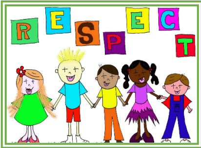
Annexe 1 : Affichage des Règles d'Or